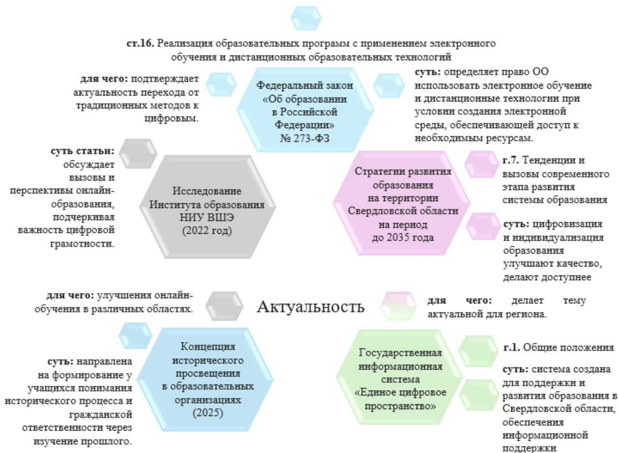
Схема 1. Нормативно-правовые и исследовательские основы цифровизации исторического просвещения

Исследование НИУ ВШЭ и концепция определили, что современные методы исторического просвещения, такие как использование цифровых ресурсов, способствуют повышению доступности и качества образования, а также формированию исторического мышления и гражданской ответственности у молодёжи [3].