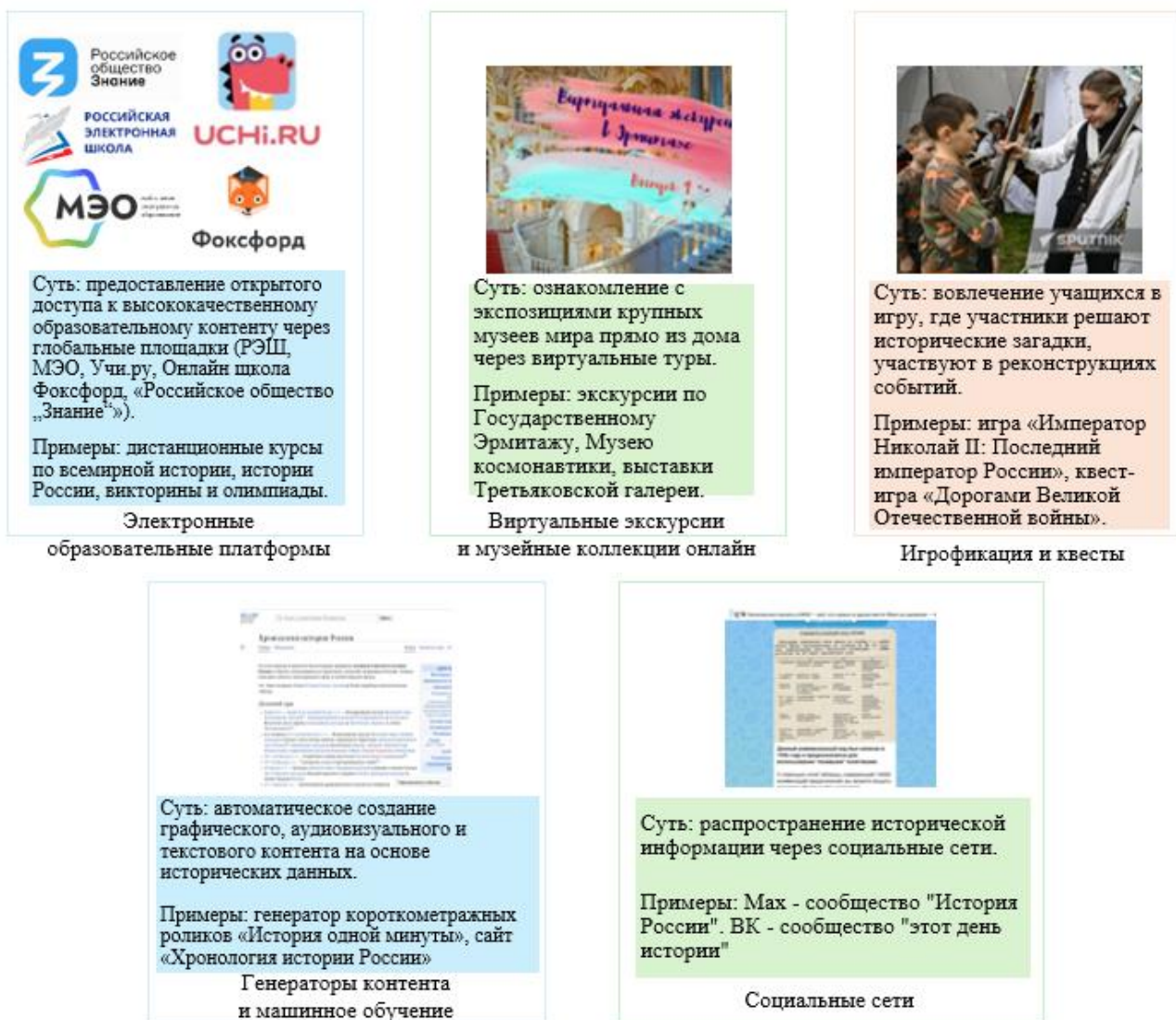
Схема 4. Характеристика современных методов исторического просвещения

Таким образом, современные методы интегрируют цифровые технологии, делая обучение интереснее, удобнее и актуальным для цифровой молодёжи.