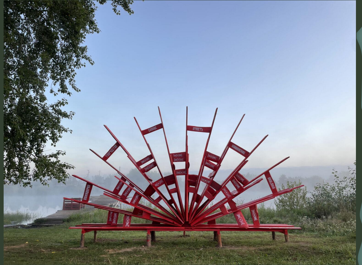
Арт-объект «Солнце руин»