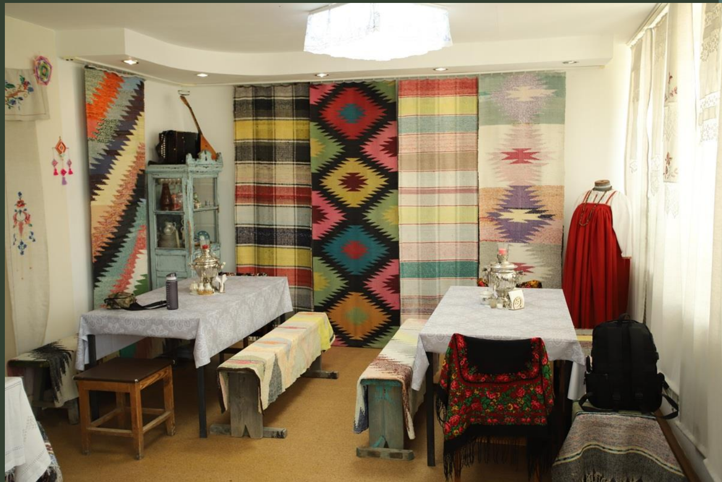
туристический информационный центр «Маминский самородок»