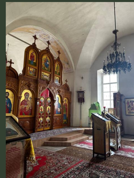
Фото сделанные во время экспедиции