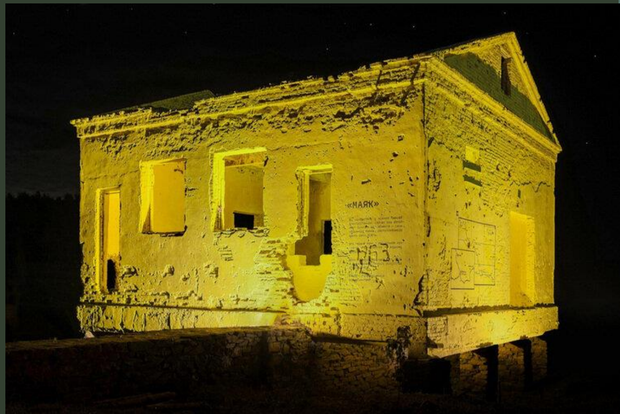
Арт-объект «Маяк» (на месте бывшей ГЭС)