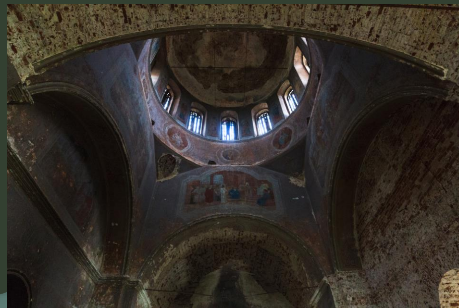
Храм во имя Архангела Михаила