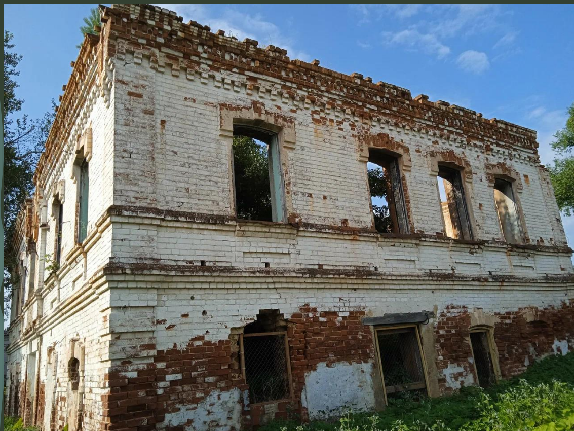
Здание сельской Управы XIX века