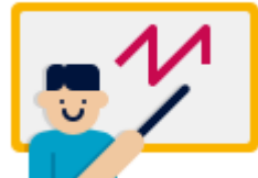
Учителя начальных классов